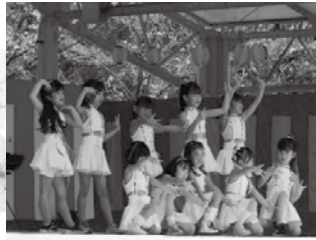
DANCE TEAM M's さんによるダンス