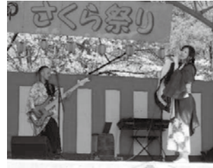
宵凧さん による歌と演奏