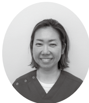
阪川歯科衛生士 お口のことなら何でも ご相談ください。