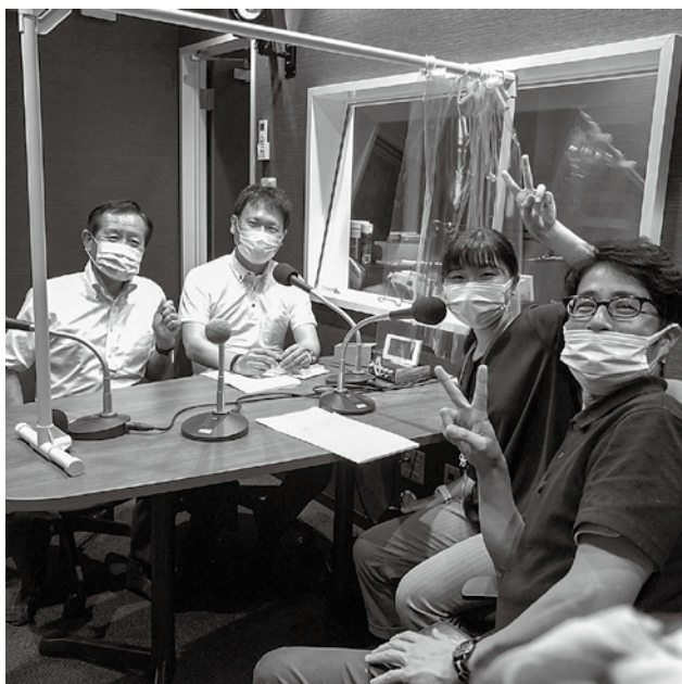
▲昨年8月にゲスト出演した時の様子

番組名「きなりと☆しもきた!」 放送日時 毎月第4木曜日 15:00~15:54