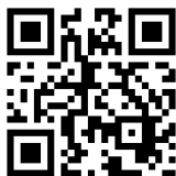
▲FMヤマト公式ホームページ