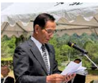
松本村議会議長追悼の辞