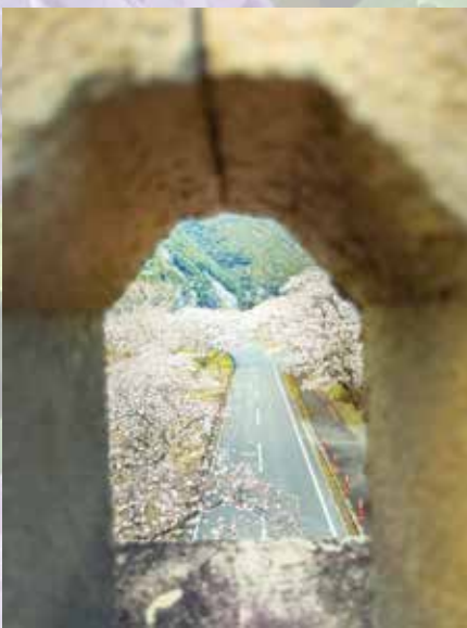
◀お隣自慢 (フォレストかみきたさん) 上北山村のフォレストかみきたから車で25分の絶景。お泊まりのお客さまにも、「最高の穴場ですが、絶対に訪れるべき場所」と必ずご案内しています!