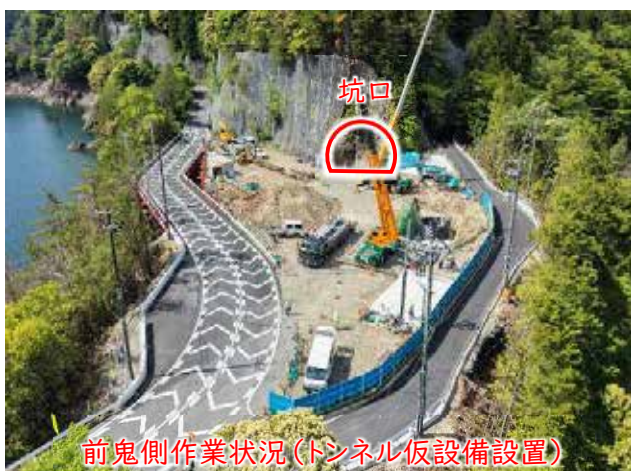
前鬼側作業状況(トンネル仮設備設置)