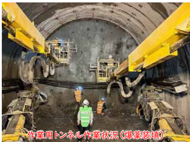
作業用トンネル作業状況(爆薬装填)