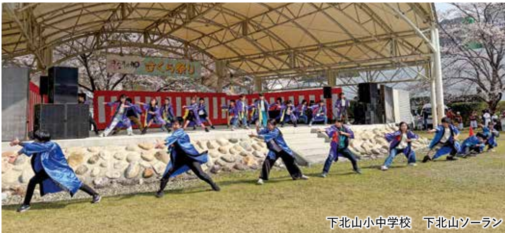
下北山小中学校 下北山ソーラン

3月29日(日)に「第39回さくら祭」が盛大に開催されました。今年で39回を迎えるさくら祭ですが、トンネル工事の影響により、祭会場は芝生広場のみでの実施となりました。好天、桜花爛漫が重なり、桜並木の下では地元物産店や出店が軒を連ね、多くの観光客で賑わいました。 ステージイベントでは、下北山小中学校の生徒による下北山ソーランや太鼓演奏、ダンス、そしてプロによる歌謡ショーなどが披露され、最後には餅まき、お楽しみ抽選会で盛り上がりました。