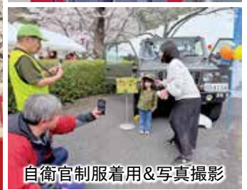
自衛官制服着用&写真撮影