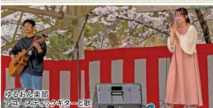
ゆるおん楽部 アコースティックギターと歌