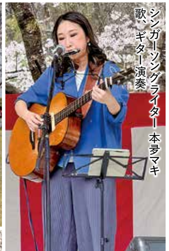
シンガーソングライター 本多マキ 歌、ギター演奏