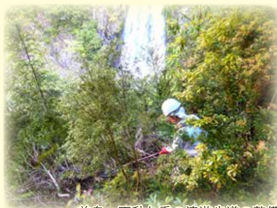
前鬼・不動七重の滝遊歩道の整備