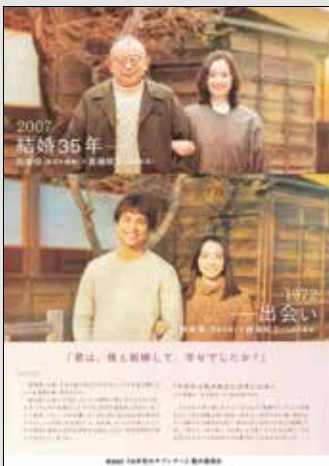
35年目のラブレター