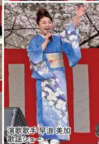
演歌歌手 早浪 美加 歌謡ショー