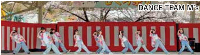
DANCE TEAM M's