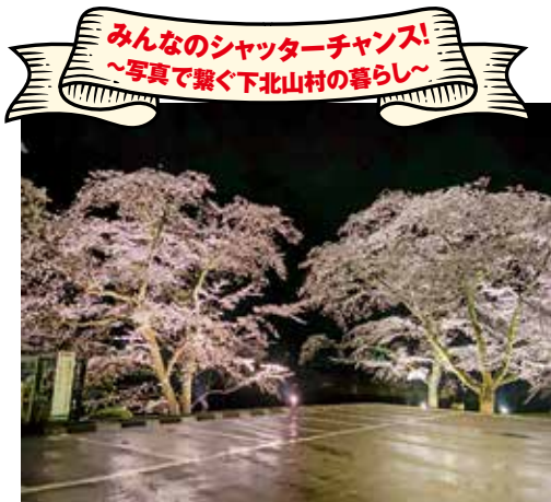
▲桜のライトアップ (大ちゃんさん) 同じライトアップでも違いがわかるピンクが綺麗

求人情報を掲載しませんか? 村内の求人情報を掲載したい方は地域振興課または商工会までご相談ください。 【問い合わせ先】地域振興課 6-0074