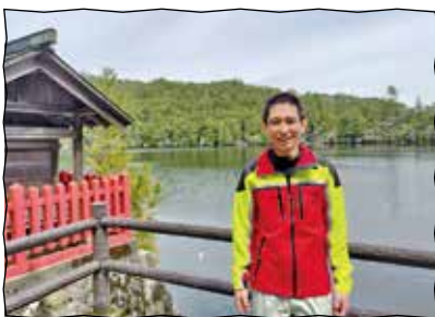
奈良県フォレスター

奈良県フォレスターとは、市町村に長期派遣され、県職員と市町村職員の身分を併任して森林管理を行う専門のプロフェッショナルです。