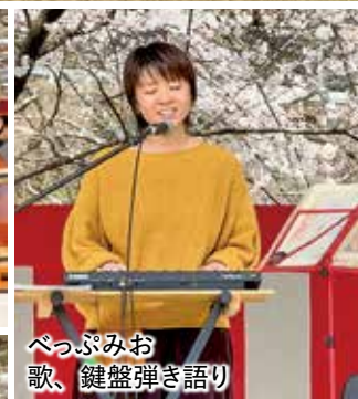
べっぶみお 歌、鍵盤弾き語り