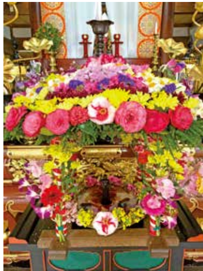
▲ののさまのお誕生日 (花田花子さん) 池原普門寺の花まつりの花御堂です。昔から伝わる方法で今年も皆様が華やかに飾り付けて下さいました(*w*)