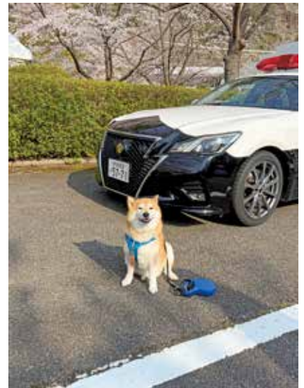
▲さくら祭のパトカーと記念撮影 (国王さん) さくら祭でパトカーとの記念撮影を呼びかけた所1番乗り!